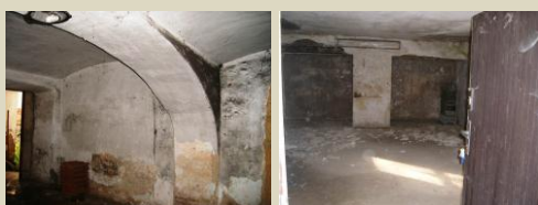
prostory určené k rekonstrukci